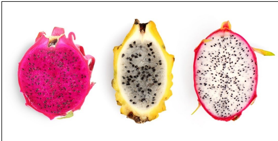
Figura 1. Variedades de pitahaya