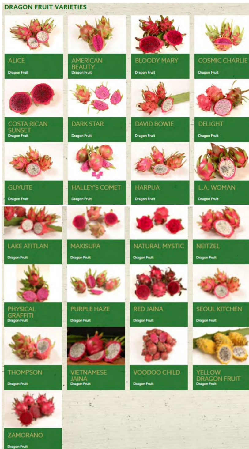
Figura 2. Nombre de las variedades de pitahaya

“Decenio de la igualdad de oportunidades para mujeres y hombres” “Año del Bicentenario de la Consolidación de Nuestra Independencia y de la Conmemoración de las Heroicas Batallas de Junín y Ayacucho”